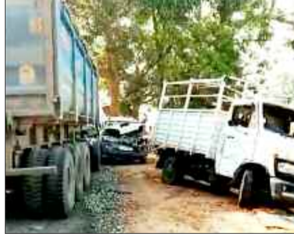
आपस में टकराए वाहन।

जारी है। हादसे में आधा दर्जन लोगों को आई मामूली चोटें, कुछ