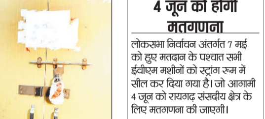
4 जून को होगी मतगणना

रायगढ़। लोकसभा निर्वाचन 2024 के तीसरे चरण में 7 मई को रायगढ़ संसदीय क्षेत्र क्रमांक 02 में मतदान प्रक्रिया संपन्न होने के पश्चात रायगढ़ जिले के 4 विधानसभाओं के ईवीएमए वी वी पै ट मशीनों के जमा करने का सिलसिला गढ़उमरिया स्थित केआईटी कालेज परिसर में चलता रहा। तत्पश्चात आज चारों विधानसभाओं के मशीनों को स्ट्रांग रूम में सील किया गया। उल्लेखनीय है कि जिले के चारों विधानसभा क्षेत्र लैलूंगा, रायगढ़, खरसिया एवं धरमजयगढ़ के लिए