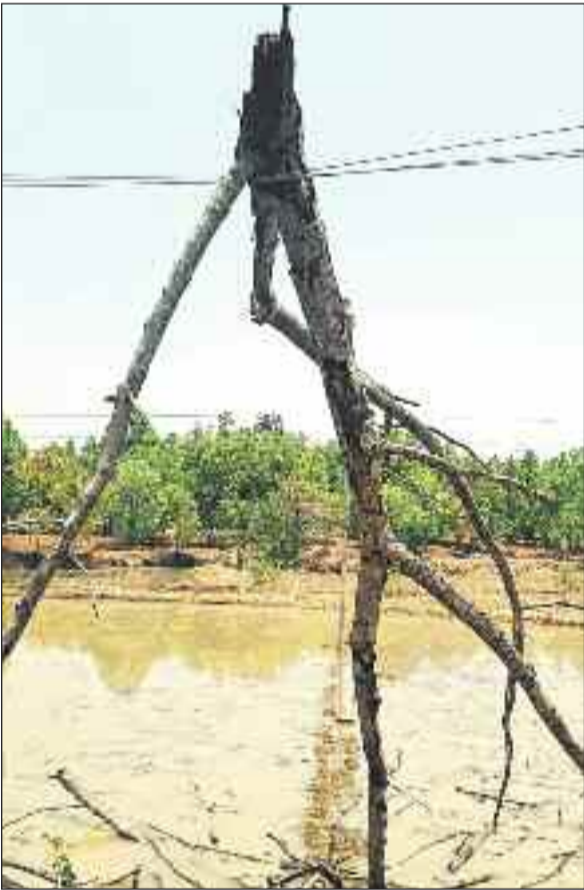
आंधी तूफान से टूटा डगाल।