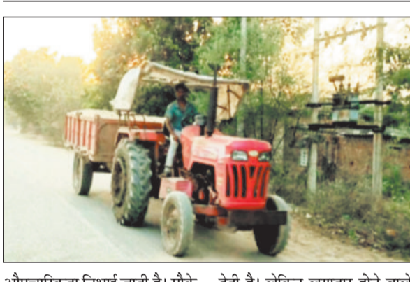
औपचारिकता निर्भाई जाती है। मौके पर पहुंची टीम कभी कभार दो चार गाड़ियों को पकड़कर जुमाना कर देती है। लेकिन लगातार होने वाले अवैध उत्खनन और परिवहन पर कड़ी कार्रवाई नहीं होती।