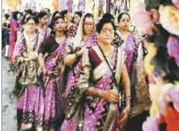
शोभायात्रा में शामिल सर्व ब्रह्मण समाज के सदस्य।

भगवान परशुराम को श्री हरि का छठा अवतार माना जाता है। परशुराम जयंती वैशाख मास के शुक्ल पक्ष की तृतीया तिथि को मनाई जाती है। जो इस बार 10 मई, 2024 यानी शुक्रवार को मनाई गई ब्रह्मण परिवार के लोग एक हफ्ते पहले से ही भगवान परशुराम जयंती की तैयारी में लगे रहे शुक्रवार