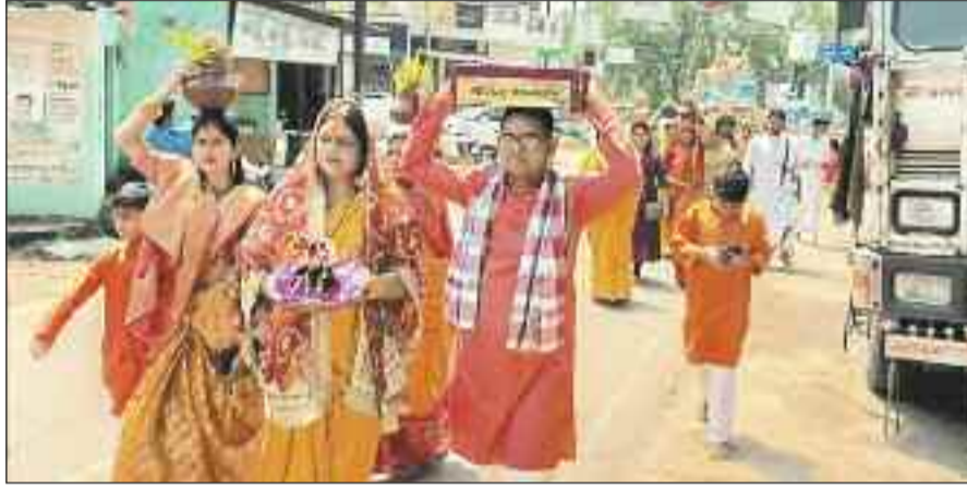
कलश यात्रा में शामिल श्रद्धालु।