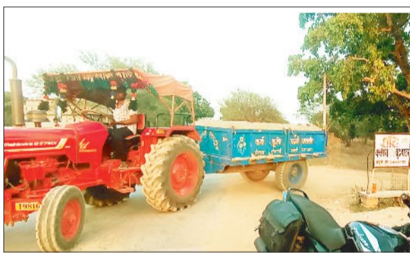
ट्रेक्टरों के माध्यम से कर रहे रेत का अवैध परिवहन।

क्षेत्र में महानदी और हसदेव से रोजाना रेत का अवैध उत्खनन और परिवहन हो रहा है। यहां से ना केवल रेत में बल्कि दिन में भी रेत लोड गाड़ियों दौड़ते रहती है, तो भारी भरकम मशीनों से रेत का उत्खनन भी बेरोक टोक हो रहा है। वहीं जिम्मेदार विभाग हाथ पर हाथ धरे बैठा है। कहीं एवं आसपास के घाटों से रेत का अवैध परिवहन बेखौफ हो रहा है। माफिया जैसीबी और चैन माउंटन लगाकर इस क्षेत्र में महानदी का सीना छलनी कर रहे हैं। इसके साथ ही अवैध परिवहन का काम भी ना केवल रात के अंधेरे में बल्कि दिन में भी बेरोक टोक होने लगा है। करही महानदी इन दिनों हर रोज ट्रैक्टरों से रेत का परिवहन धड़ल्ले से होता है। दिन और रात दौड़ रही गाड़ियां सैकड़ों ट्रिप रेत लेकर जाती हैं। इसके अलावा क्षेत्र से बड़े वाहनों में भी रेत का अवैध परिवहन होता है। इन सब पर रोक लगाने वाला जिम्मेदार खनिज विभाग द्वारा कार्रवाई के नाम पर महज